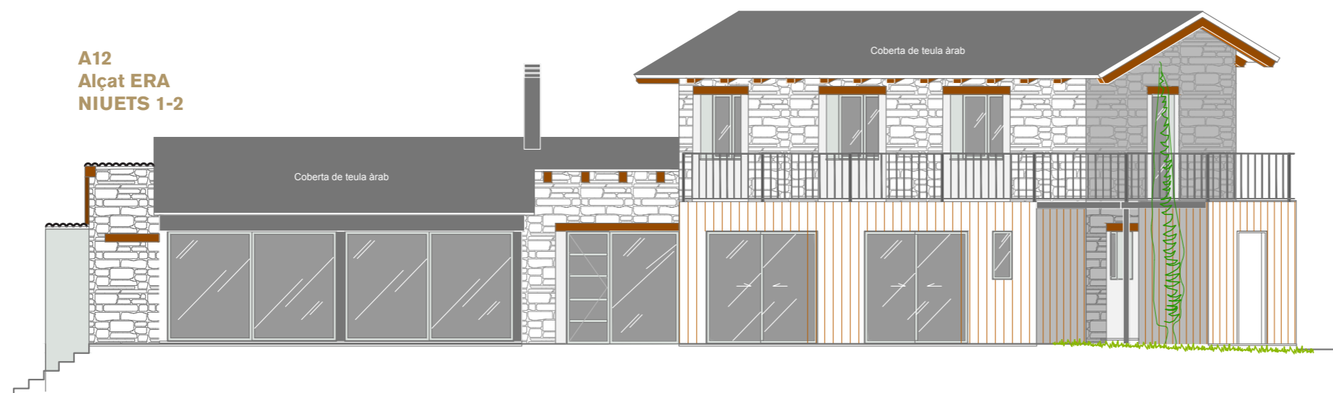
A12 Alçat ERA NIUETS 1-2

ALÇATS - VII Planta general "Els Niuets de Santa Eugènia"