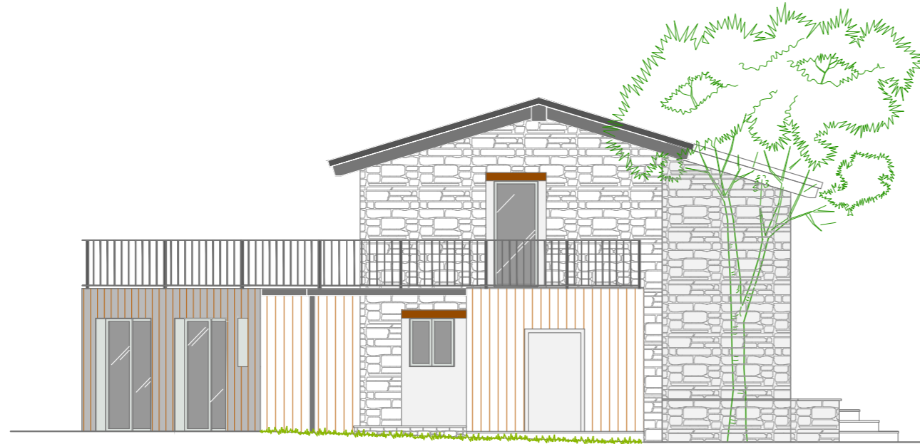
A13 Alçat lateral NIUET 1